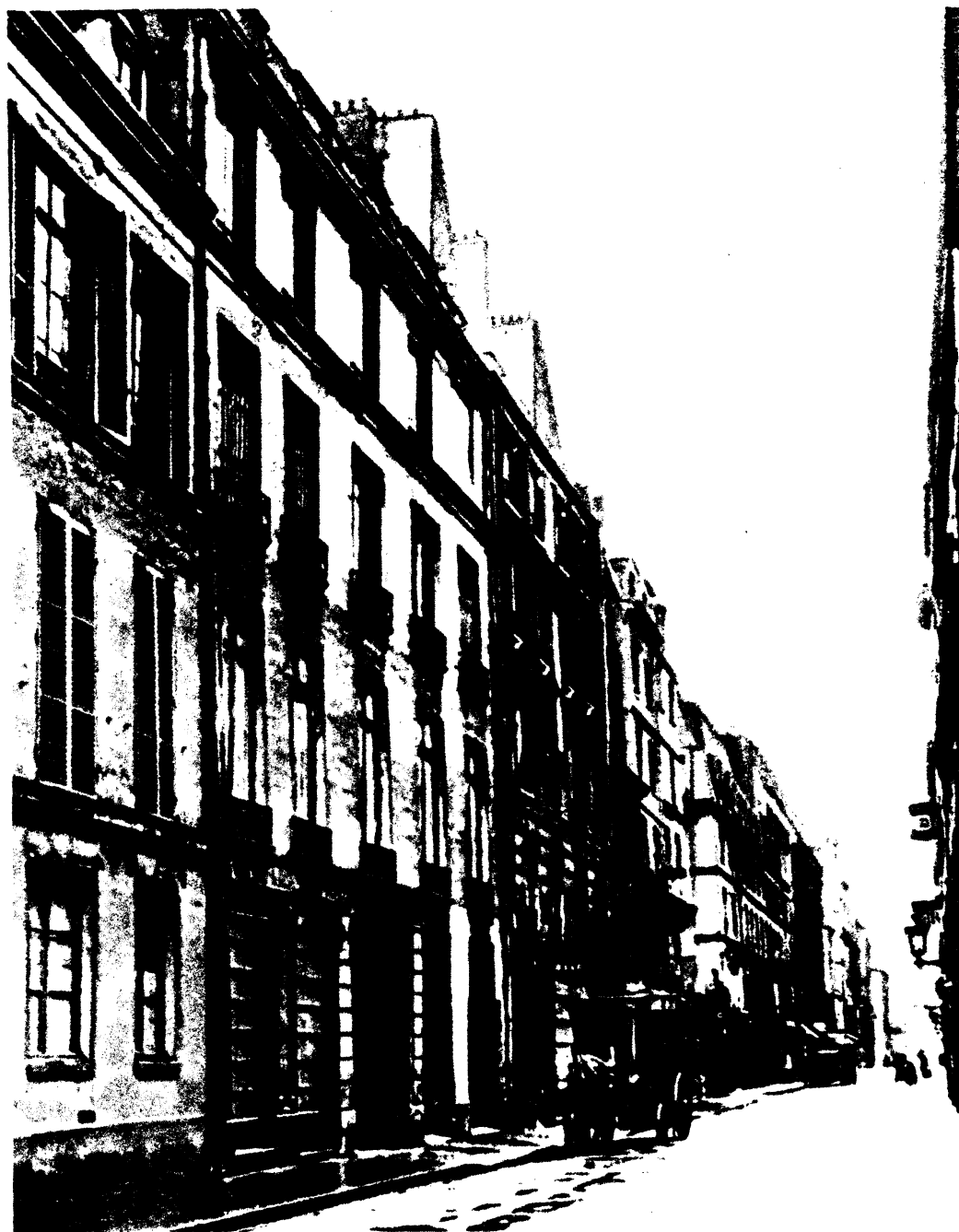
恩格斯在巴黎住过的房子 (1846年11月—1847年3月)