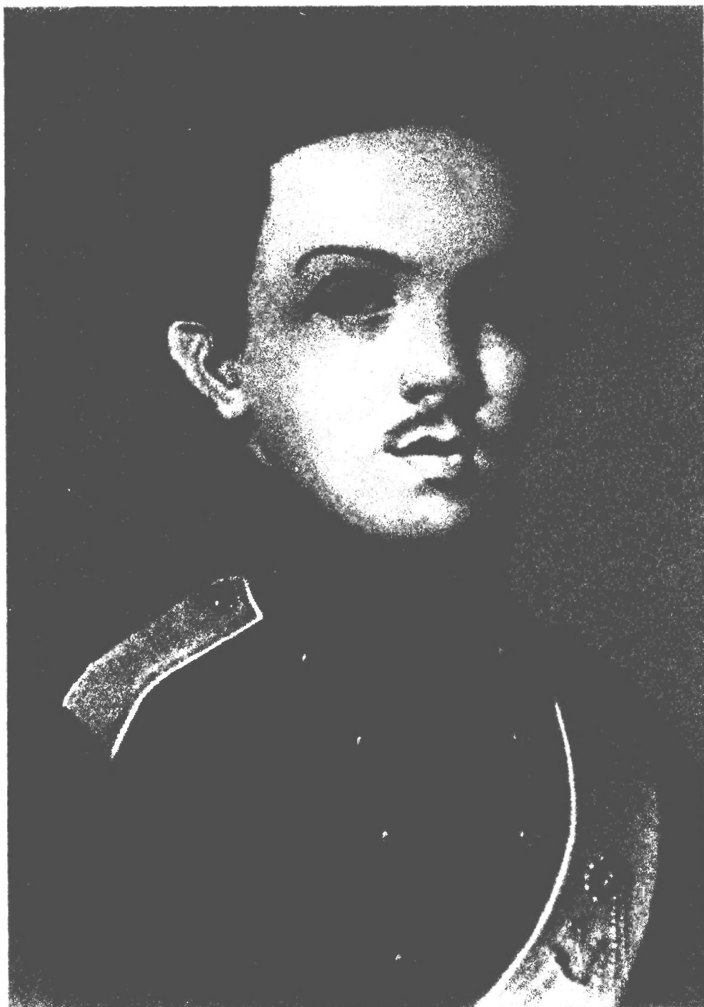
服兵役时的弗里德里希·恩格斯 (1841年于柏林)