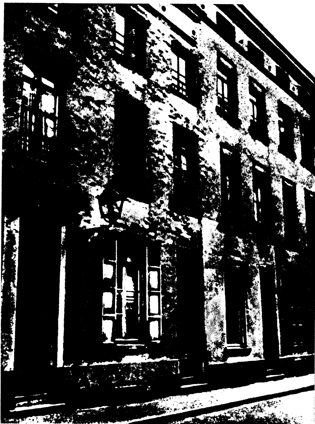
马克思在布鲁塞尔住过的房子 (1845年5月—1846年5月)