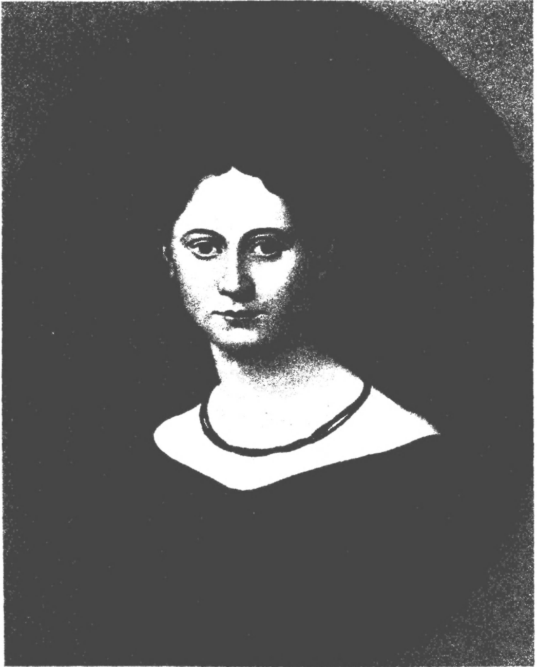
青年时代的燕妮·马克思