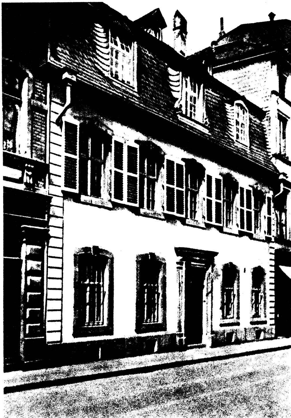
马克思在特利尔的诞生地