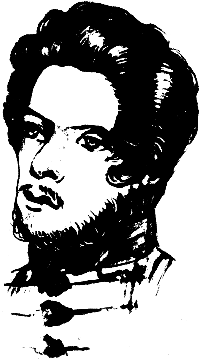
学生时代的卡尔·马克思 (1836年于波恩)