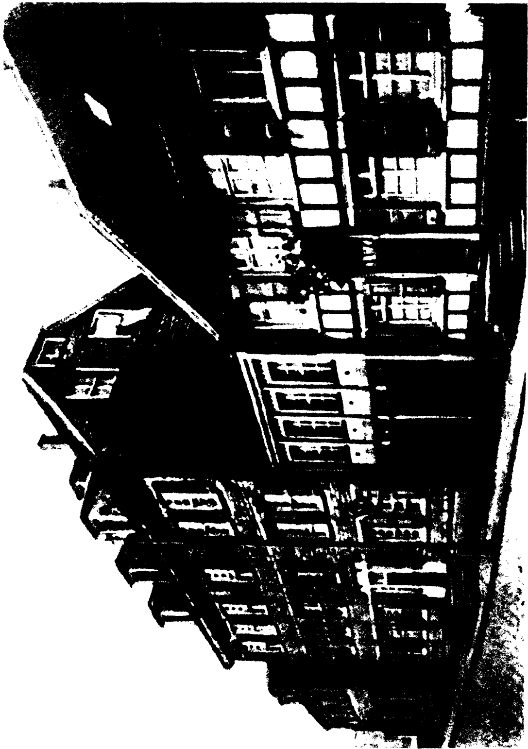
恩格斯在巴门的诞生地