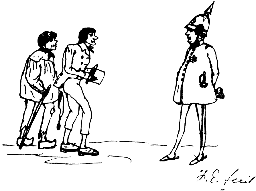
弗·恩格斯所作的对普鲁士国王 弗里德里希-威廉四世的讽刺画 (1848年)